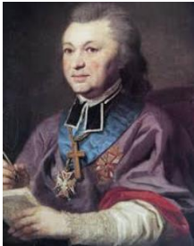
Юзеф Казимир Коссаковский

Юзеф Казимир Коссаковский (1738 — 1794) - государственный и военный деятель Речи Посполитой, участник Барской и Тарговицкой конфедераций, руководитель Тарговицкой конфедерации в Литве, последний гетман великий литовский.