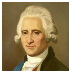
Я. Е. Сиверс

Яков Ефимович Сиверс (1731 — 1808) - русский государственный деятель, чрезвычайный посол в Польше в 1793г., один из наиболее передовых деятелей Екатерининской эпохи.