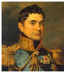
П. М. Волконский

Пётр Михайлович Волконский (1776 – 1852) - русский военный и придворный деятель из рода Волконских, генерал-фельдмаршал, министр императорского двора и уделов. Помогал М.К. Огинскому в организации встреч с императором Александром I.